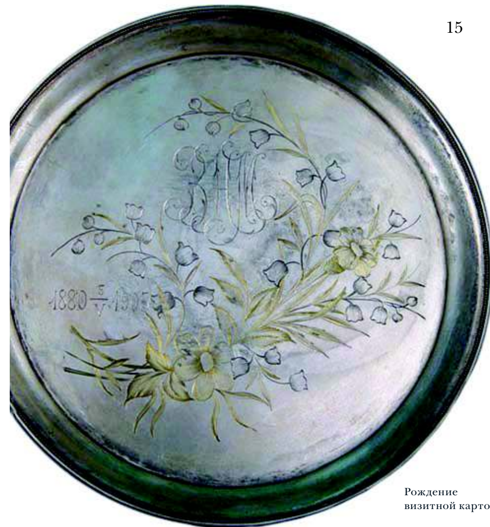
Рождение визитной карточки

современным футлярам- визитницам, фарфоро- вые, золотые, серебря- ные коробочки, иногда богато декорированные, предназначались для хранения собственных визитных карточек.