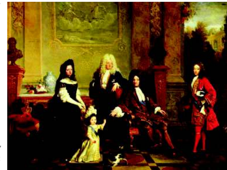
Портрет Людовика XIV и его наследников НИКОЛА ДЕ ЛАНЖИЛЬЕР Нач. XVIII в.

До этого времени изготовлением визитных карточек занимались мастера-граверы. «Из до-