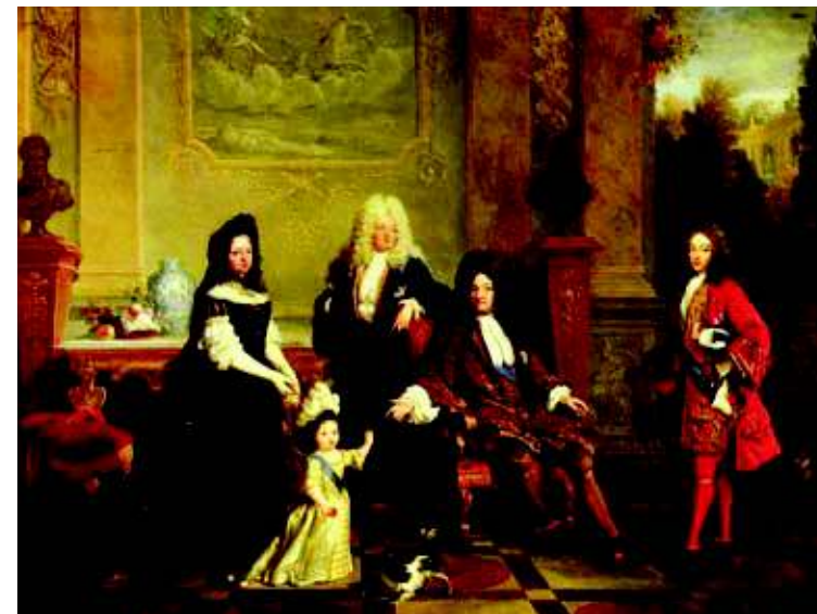
Портрет Людовика XIV и его наследников НИКОЛА ДЕ ЛАНЖИЛЬЕР Нач. XVIII в.

До этого времени изготовлением визитных карточек занимались мастера-граверы. «Из до-