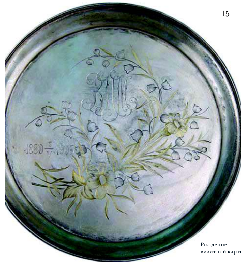
Рождение визитной карточки

современным футлярам- визитницам, фарфоро- вые, золотые, серебря- ные коробочки, иногда богато декорированные, предназначались для хранения собственных визитных карточек.